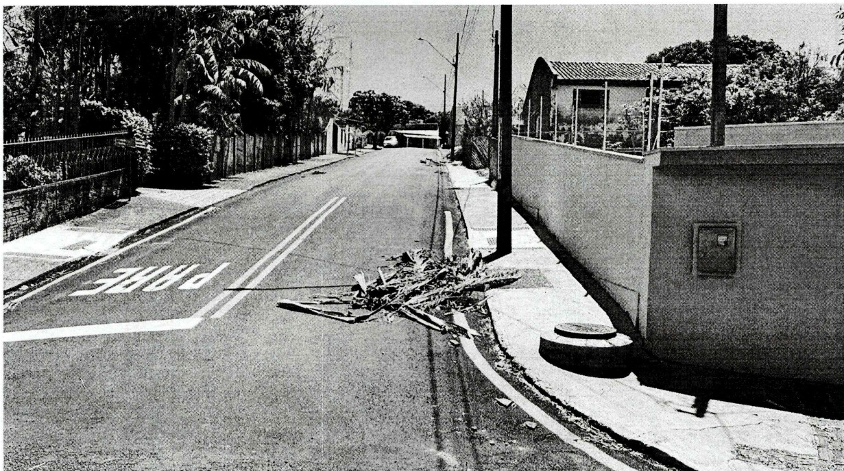
Figura 3- Lateral esquerda do lote, confrontando com o lote nº 29, com extensão de 50,00 m, conforme registrado na matrícula.