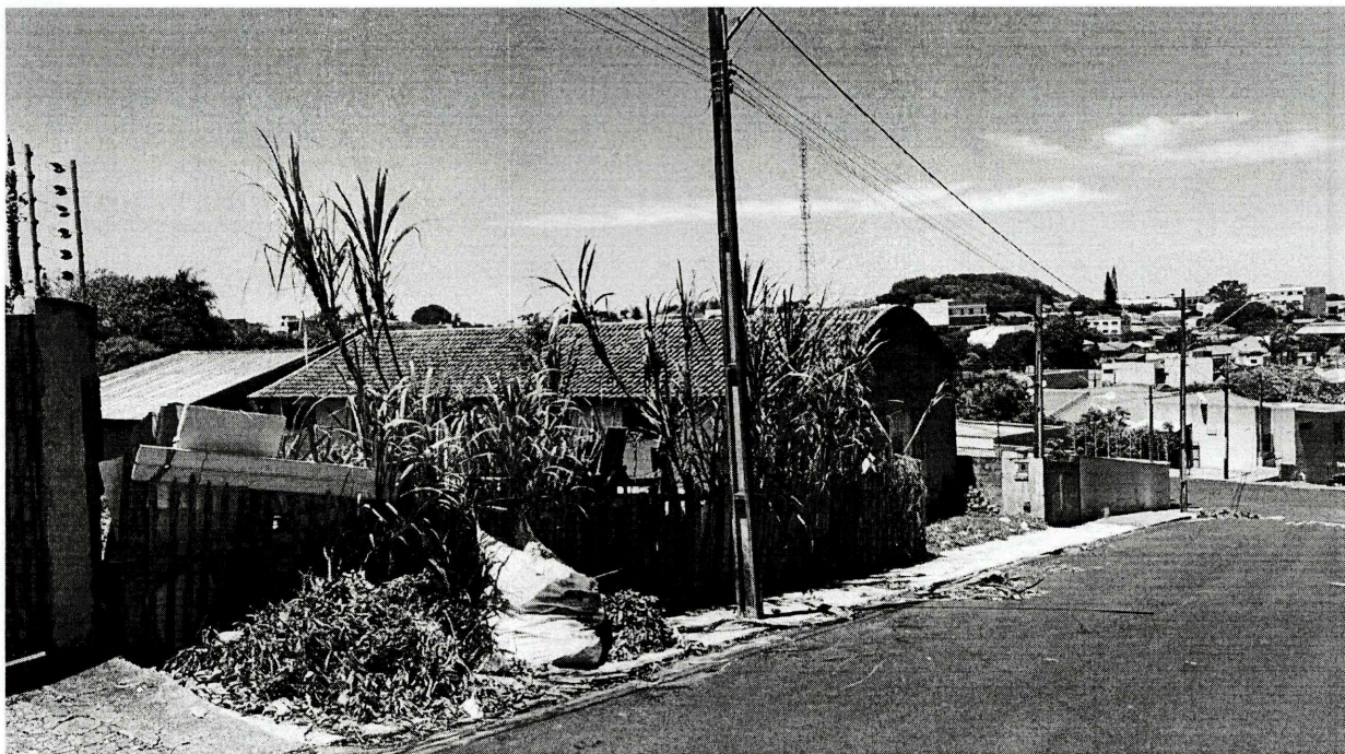
Figura 2 - Lateral esquerda do lote, confrontando com o lote nº 29, com extensão de 50,00 m, conforme registrado na matrícula.